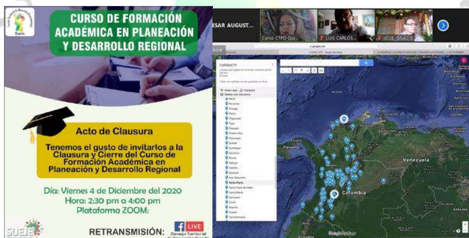
Localización de los estudiantes del curso.