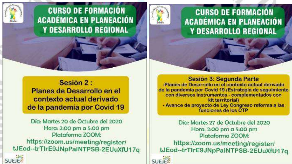
Pieza Publicitaria del Curso de Formación Académica