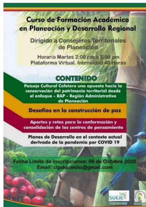
Pieza Publicitaria del Curso de Formación Académica

En los enlace https://cursoctpdquindio.sueje.edu.co , igualmente en la página del CTPD Quindío http://www.ctpd.gobernacionquindio.gov.co , pueden consultar todas las sesiones del curso y de requerir mayor información se pueden dirigirse al ctpdquindio@gmail.com , donde con todo gusto estamos prestos a resolver sus inquietudes.